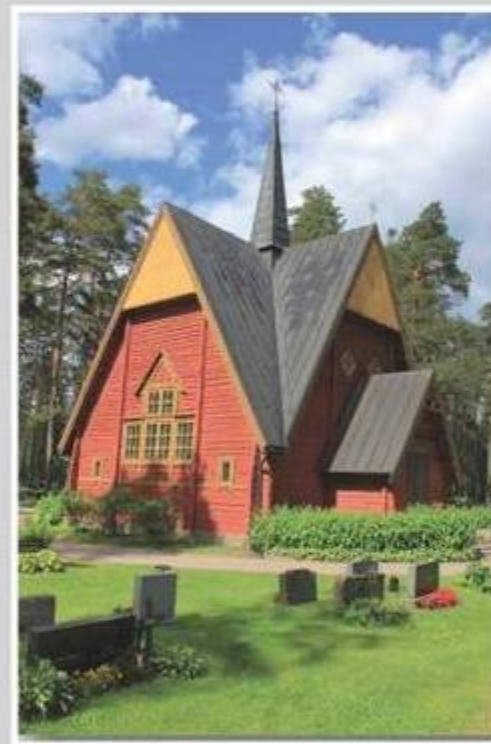
Nyströmin kappeli on kuin satulinna.