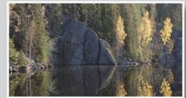
Torisevaa muistomerkin vastarannalla.

Juhlailtamat 14.11. klo 19 Jäähdyksylän kylätalo Jukolassa (Jäähdyksylän tie 58).