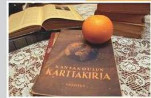
Virinässä esitellään Inhan elämäntyötä.

Onnea Into! t. Janne 12.7. klo 15 kylätalo Jukolassa (Jäähdyksylän tie 58). KesäVirrat Soi! -tapahtuman Sibelius-mahtina.