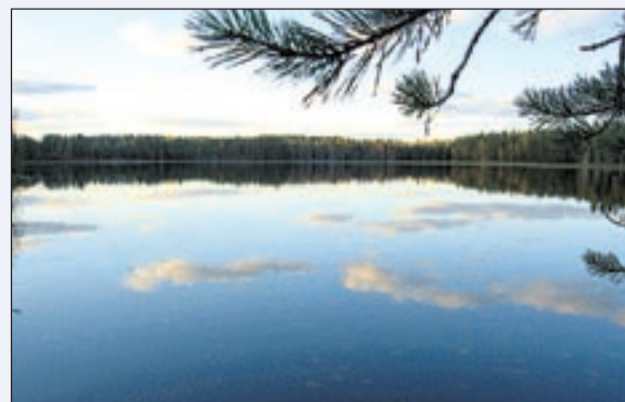
Kurjenjärven ja Joutsenjärven pintaa on laskettu 1930-luvulla melkein metrillä.