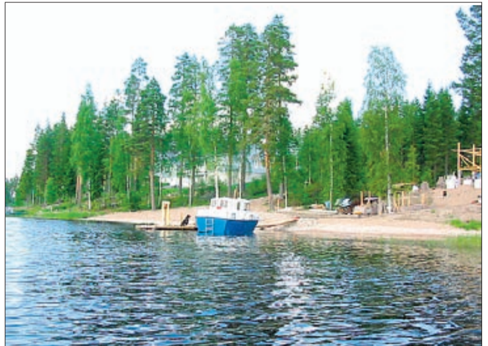
Ranta-Keiturin omarantaisilla tonteilla olisi vieläkin kysyntää runsaasta myynnistä huolimatta.

- Esimerkiksi vapaa-ajan asuntoja siirretään lasten nimiin yhä enemmän, Jussi Mäkitalo ja Kämäri toteavat.