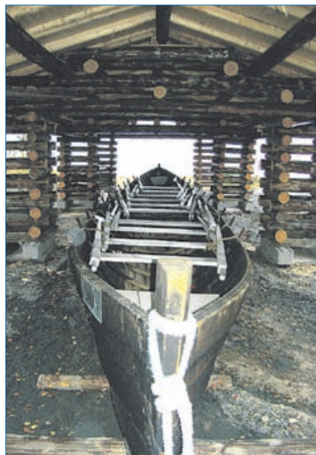
Kirkkovene Koro II sai suojakseen uuden kirkkovenekoppelin.

Kirkkoveneellä on suuri rooli kylässä. Tavoitteena on saada kirkkovenekulttuuri jatkumaan myös nuoremalle väestölle.