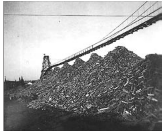
Puun raaka-aineen siirtoon käytettiin ilmarataa.

Killinkoskea ympäröivät maisemallisesti kauniit vesistöt ja laajat erämaa-alueet antavat monipuoliset mahdollisuudet perinteisten kalastuksen ja metsätyksen lisäksi muihin luontoon liittyviin harrastuksiin.