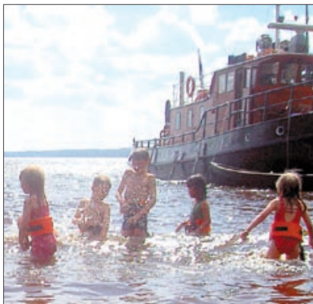
Tulevaisuudessa Virtain kylillä avautuu työpaikkoja niin lapsi- kuin...

kotipalveluun tarvitaan tulevaisuudessa työvoimaa kylillekin.