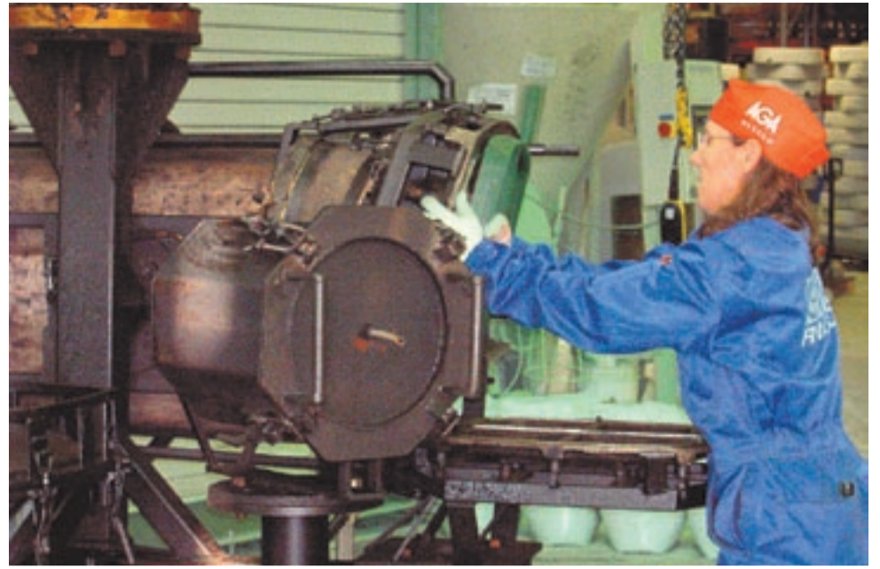
Finncont Oy:n laajentuessa tuotannossa tapahtuu uusia työtehtäviä.