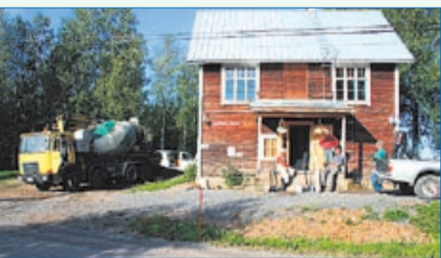
Kylätalo Jukolasta on talkoovoimin rakentunut kylän yhteinen kokoontumispaikka.

Jäähdyshojan kylätalo Jukolan sali alkaa olla valmis I. K. Inhan juhlaillamien varten.