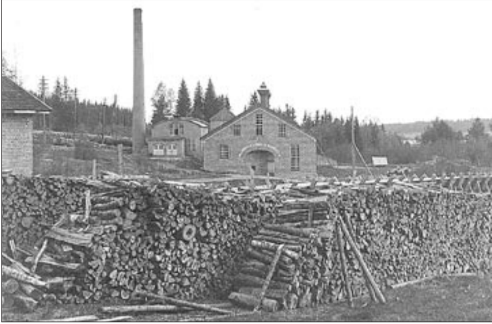
Killinkosken puuhiomo. Etualalla tukkiruuvi, taustalla näkyy tuubi ja Suomen ainoa tynnyrikanava.

Jokaisella Maaseudulla on elämää -hankkeessa mukana olevalla Virtain kylällä on omat erikoispiirteensä ja vahvuutensa.