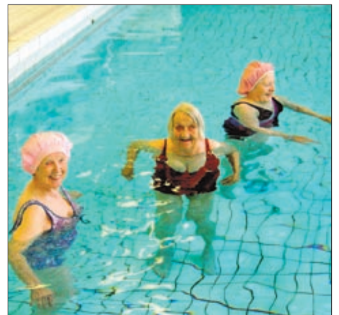
...vanhustyöstä kiinnostuneille.