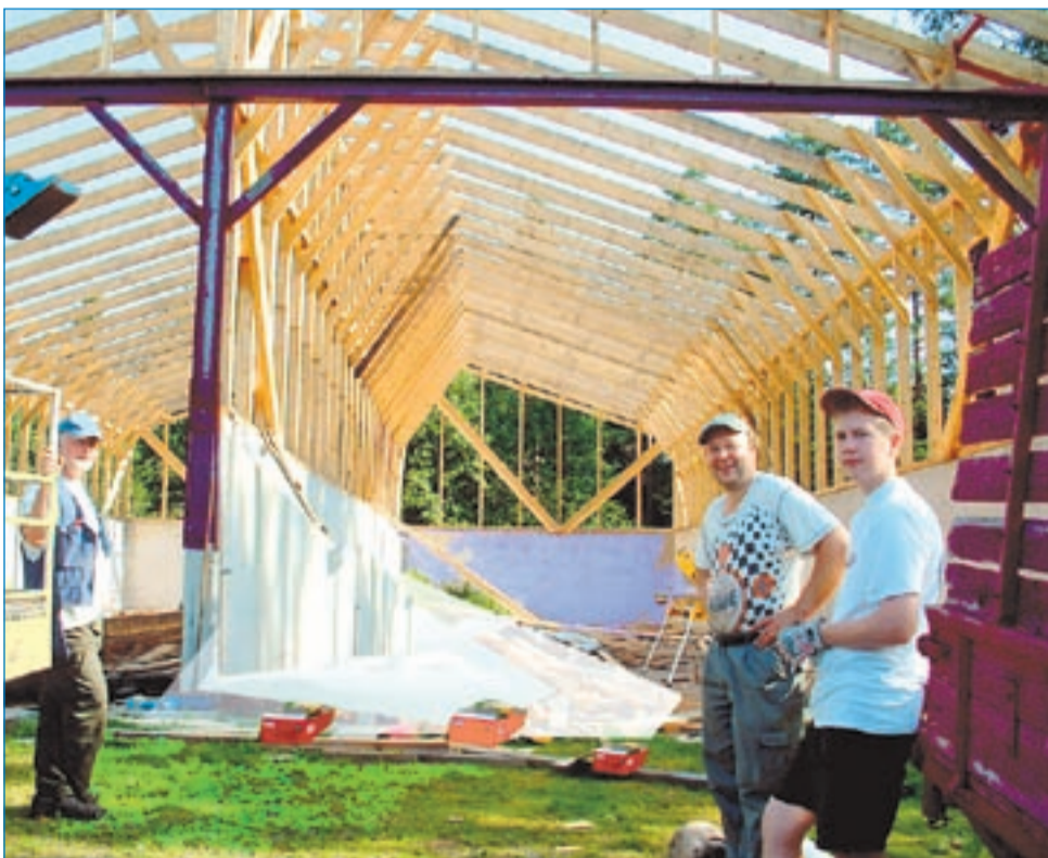
Maaseudun rakentamisessa korostuu Virroillakin kookkaiden tuotantorakennusten ja kalustusosojen rakentaminen.

Ympäristölautakunta on halunnut toteuttaa osallistu-