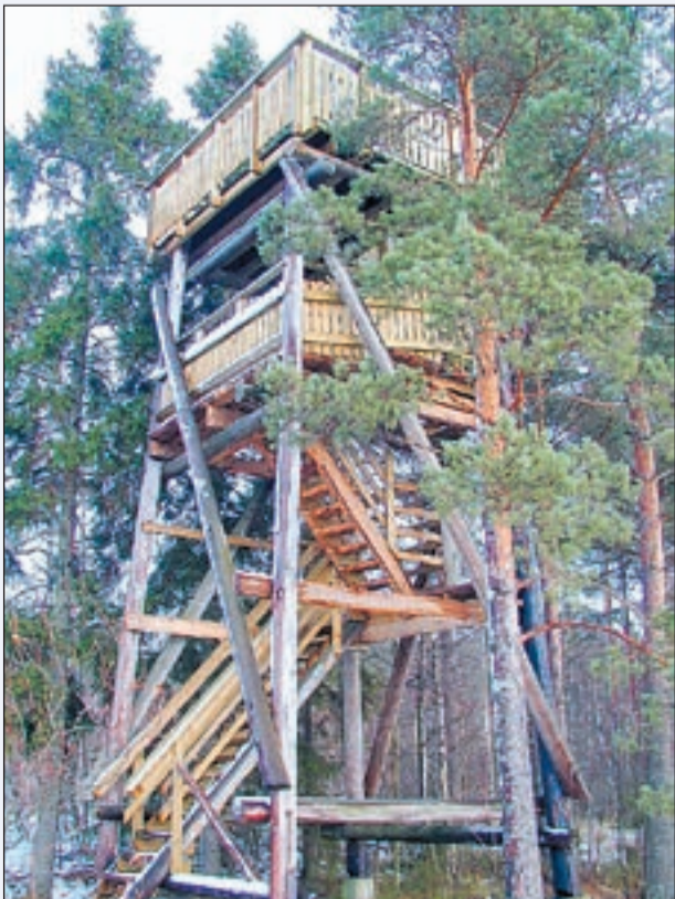
Kunnostettu lintujen tarkkailutorni houkuttelee luontoretelle Rantakunnalle.

Kyläläiset toivottavat kulkijat tervetulleiksi asumaan tai vaikka luontoretelle lintutornille ja sen läheisyydessä oleville laavulle ja kodalle levähtämään.